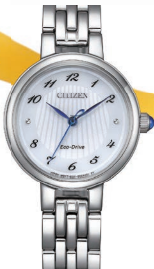
2 CITIZEN L ø 27,7mm EM0990-81A € 229,-