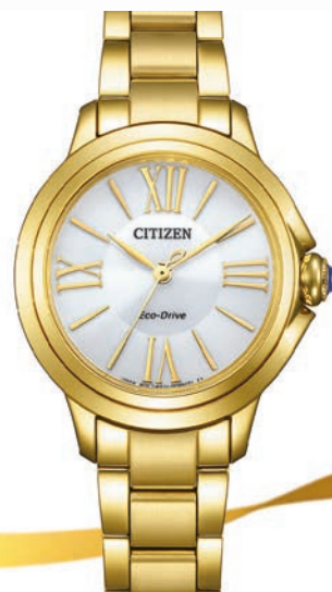
CITIZEN L ø 30,25mm EM1162-52A € 379,-