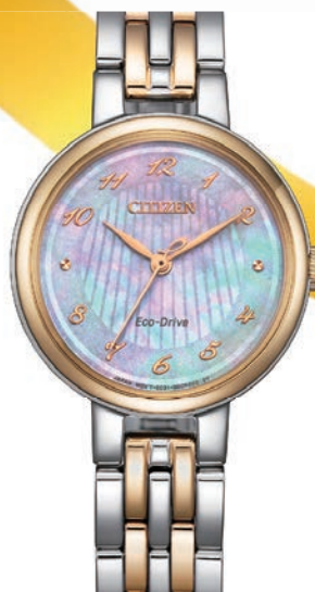
1 CITIZEN L ø 27,7mm EM0996-84Y € 269,-