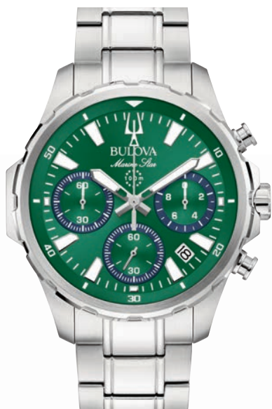
BULOVA MARINE STAR ø 34mm