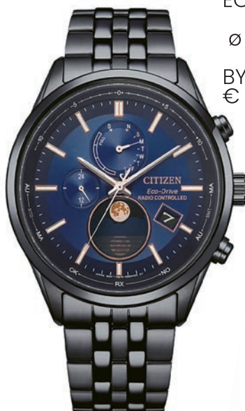
ECO-DRIVE ø 42mm BY1035-56L € 469,-