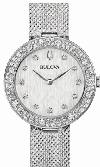
ANALOG QUARTZ ø 32mm