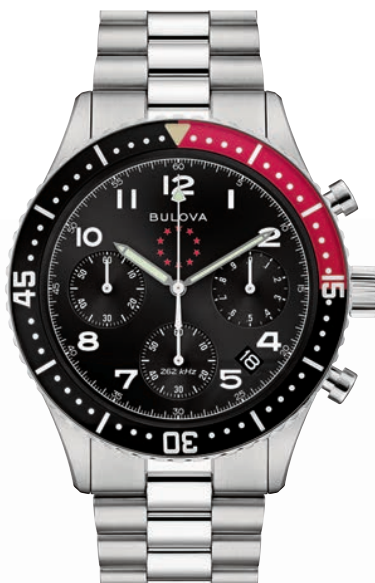
BULOVA ARCHIVE ø 42,85mm