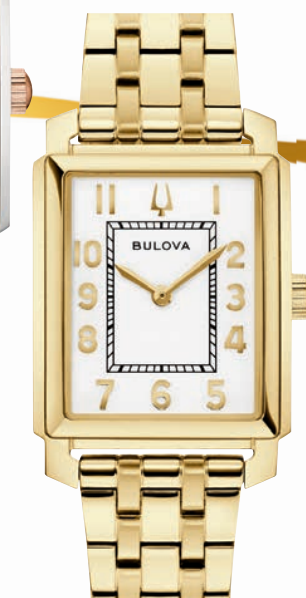
SUTTON ø 25mm