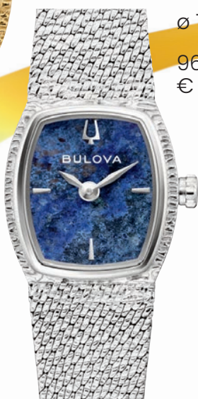
RUBAIYAT ø 17mm