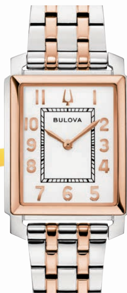
SUTTON ø 25mm