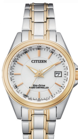
ECO-DRIVE ø 29,3mm EC1186-85A € 399,-