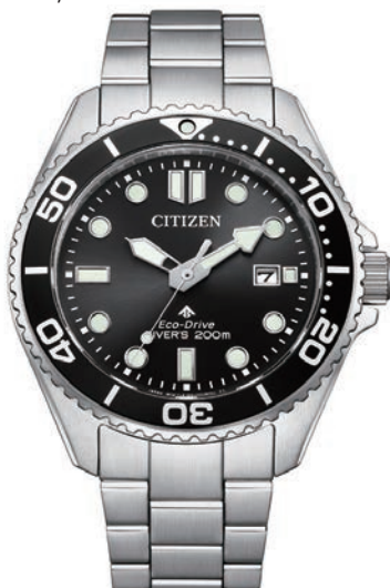
ECO-DRIVE ø 40,55mm BN0261-51E € 349,-