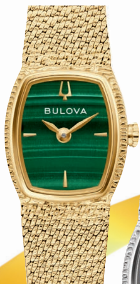
RUBAIYAT ø 17mm