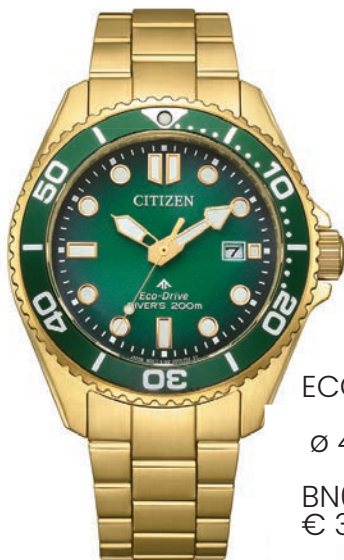
ECO-DRIVE ø 40,55mm BN0262-59W € 399,-