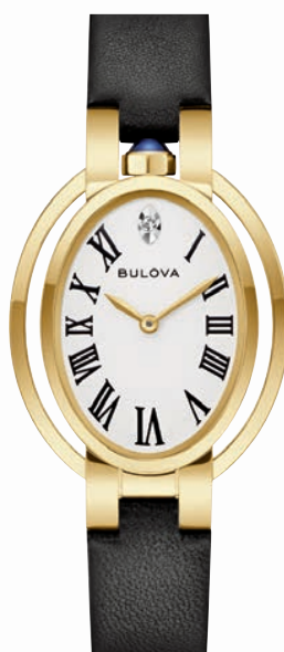
ANALOG QUARTZ ø 28,8mm