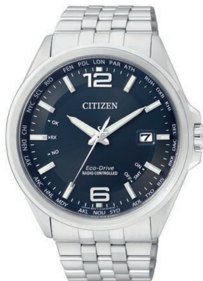
ECO-DRIVE ø 43mm CB0010-88L € 389,-