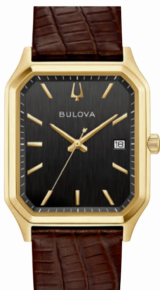
ANALOG QUARTZ ø 32mm